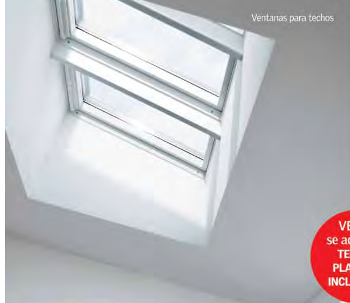
Ventanas para techos