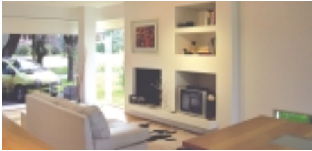
GRAN RELACION INTERIOR-EXTERIOR FACILITADA POR LOS VIDRIOS.

contribuyendo a la riqueza del proyecto, de imagen moderna. La pérgola que arma la galería posterior, utilizada como espacio para comer al exterior y cercano a la parrilla, se realizó con estructura metálica y