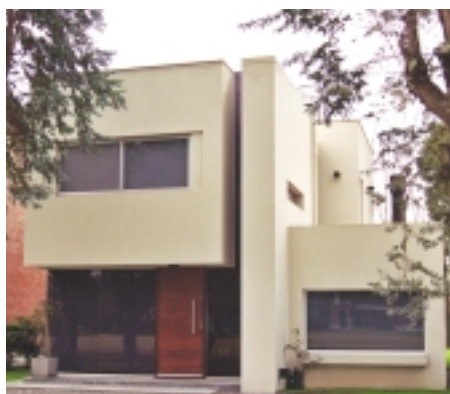
LA VIVIENDA OFRECE UNA IMAGEN MODERNA, COMPUESTA CON GRAN EQUILIBRIO DE ELEMENTOS