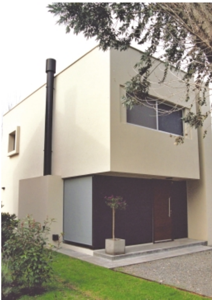
HACIA EL FRENTE, SE ABRIÓ EL ÁNGULO DE LA FACHADA, BUSCANDO PRESERVAR, CON LA UTILIZACIÓN DE VIDRIO, LAS VISTAS AL GOLF.

Tratándose de una vivienda de fin de semana, se proyectaron plantas muy funcionales, con locales integrados, libres de tabiquerías formales y sin espacios ociosos.