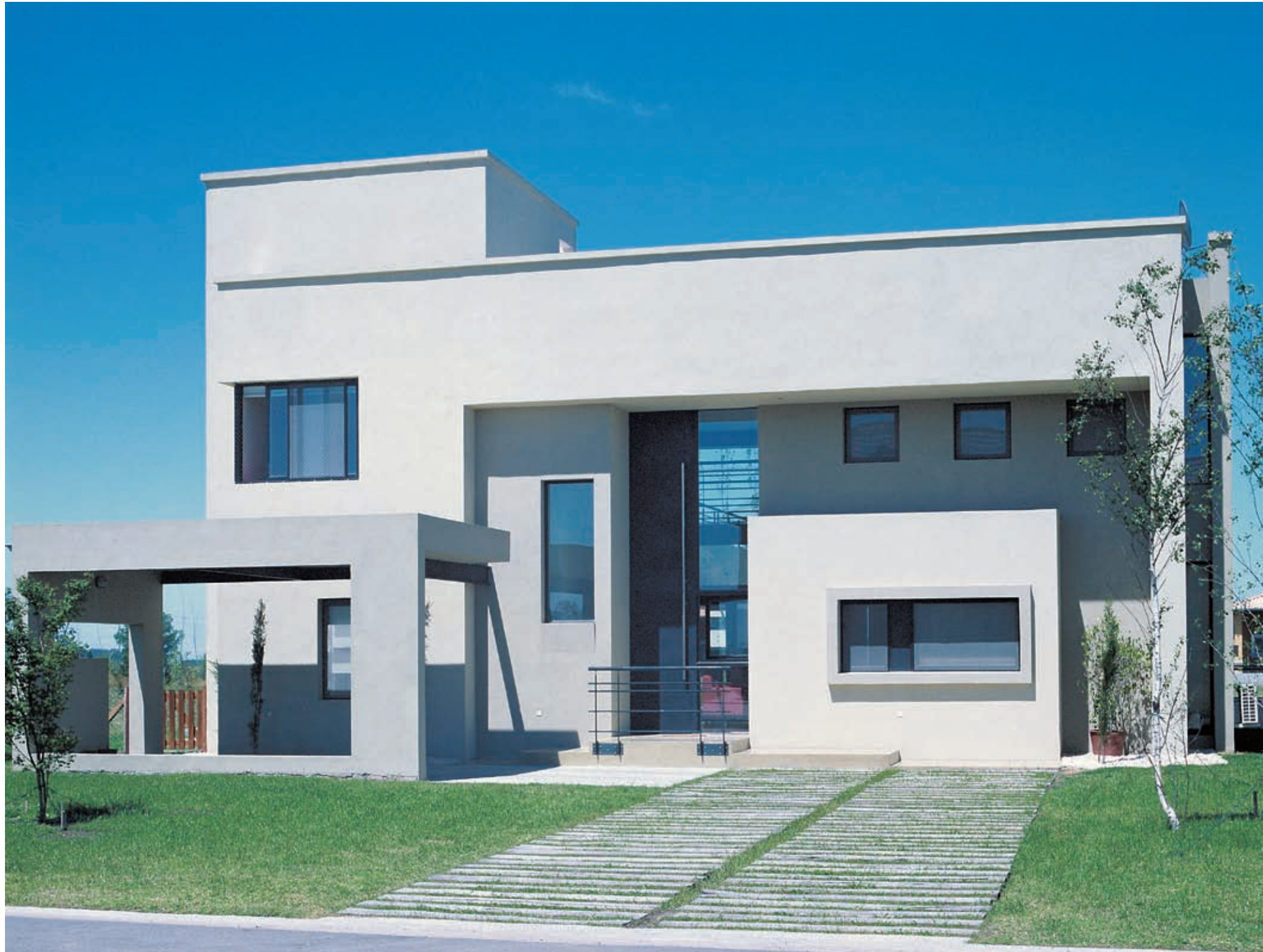
El espacio en su dimensión utilizable funcionalmente, y el espacio como elemento componente del proyecto. Ambas acepciones son válidas en esta vivienda diferente.